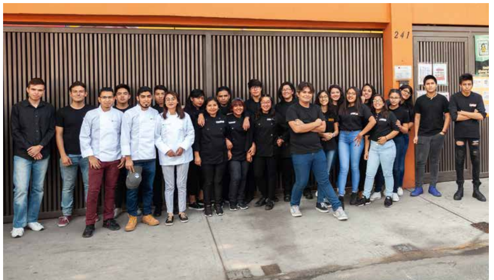
Die Auszubildenden in Martín Carrera ergreifen ihre Chance und halten zusammen.

Alle Kurse des Zentrums sind staatlich zertifiziert, sodass die Absolventen bei der anschließenden Jobsuche gute Chancen auf qualifizierte Arbeit haben. Und auch Existenzgründer werden gezielt gefördert. Doch das Zentrum sieht sich nicht nur als Ort des Lernens. Es will auch ein Ort der Gemeinschaft und gelebter Soli-