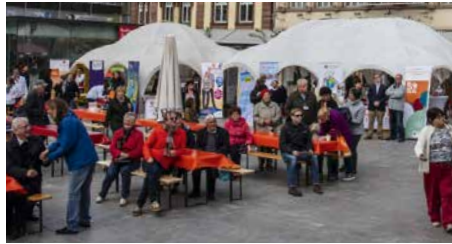
Der Aktionstag auf dem Universitätsplatz in Fulda fand großes Interesse.