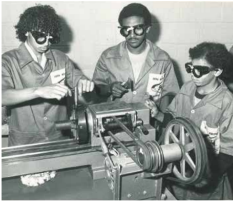
In den 70er Jahren so wichtig wie heute: Bildungskurse in Brasilien.

80er Jahren begann KOLPING in etlichen lateinamerikanischen Ländern, mithilfe von Kleinkreditprogrammen kleine Handwerksbetriebe zu unterstützen. Finanzielle Starthilfen und Bildungsmaßnahmen im Bereich Existenzgründung sollten Hand-