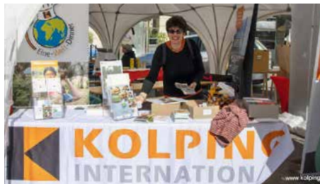
Infostand von KOLPING INTERNATIONAL.