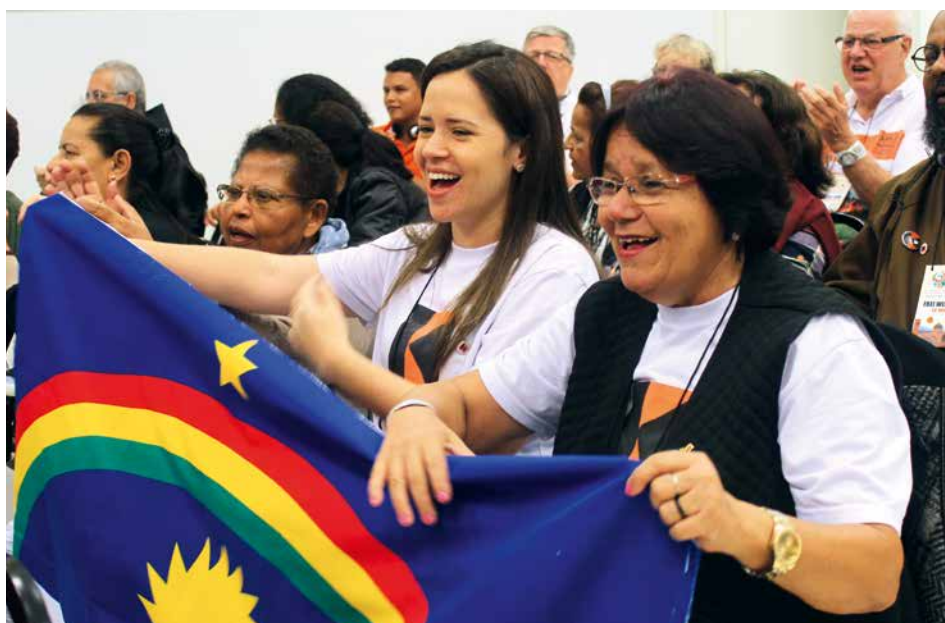
In Aparecida/ Brasilien wurde im Juni 2018 „50 Jahre Aktion Brasilien“ gefeiert. Mit diesem Projekt begann 1968 die weltweite KOLPING-Entwicklungszusammenarbeit.