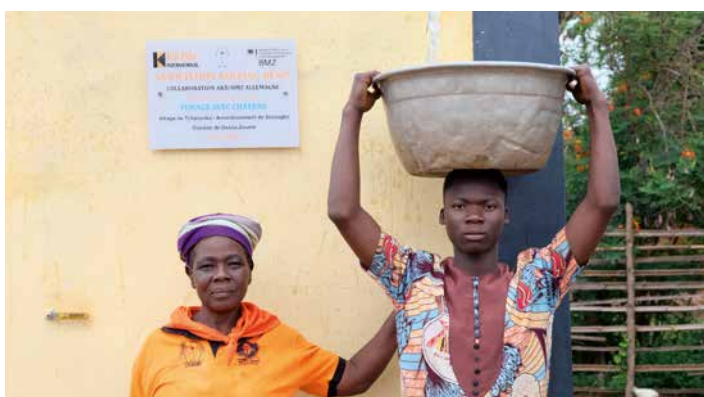
Im togolesischen Ahépé versorgt seit 2025 ein Tiefbrunnen die Einwohner des Dorfes mit sauberem Grundwasser.